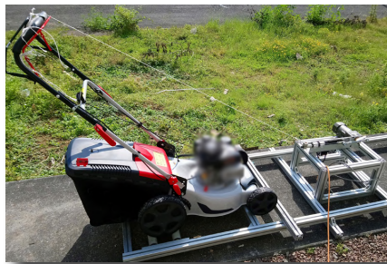
> Essais d'endurance sur moteur thermique et boîte de vitesse