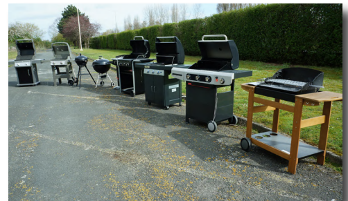
> Essais d'endurance sur barbecues