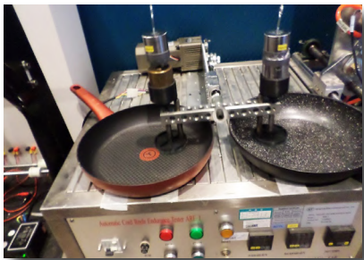
> Essais de durée de vie revêtement anti-adhésif par abrasion