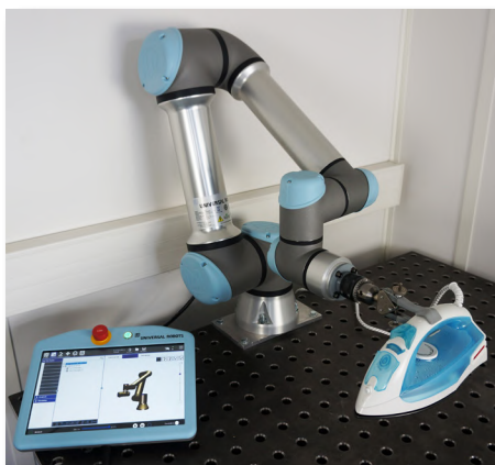
> Essai d'endurance sur fer à repasser selon la norme : IEC 60311 (Méthode mesure de performance)